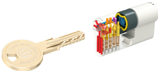
Afb.: Stysteem 5 stiften