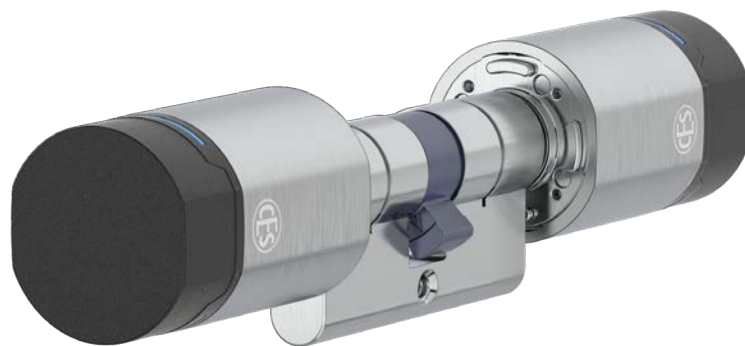
EB8710 | EB9710 Cylindre européen