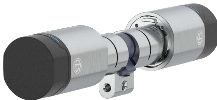
EB6710 Cylindre rond suisse