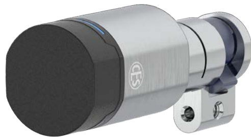
EB651 Zwitserse ronde cilinder