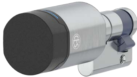
EB851 | EB951 EU-profielcilinder