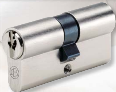
Sicherheits-Profilzylinder 8710 WSZ

Für den CES Profilzylinder 8710 WSZ sind weitere Bauformen erhältlich. So können mit einem Schlüssel nicht nur die Haustür, sondern auch Briefkasten, Garagentor und andere Zugänge verschlossen werden.