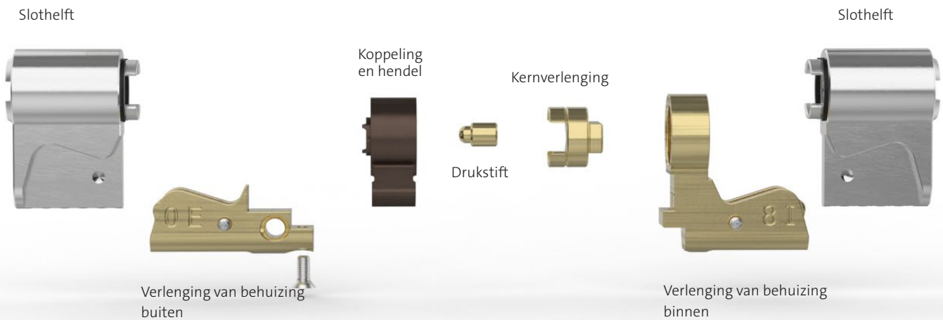
Afbeelding van een dubbelcilinder 812MO + MOKI-08-00 met afmeting 35,5 (binnen)/27,5 mm (buiten)

Hier vindt u een animatie van de montage: